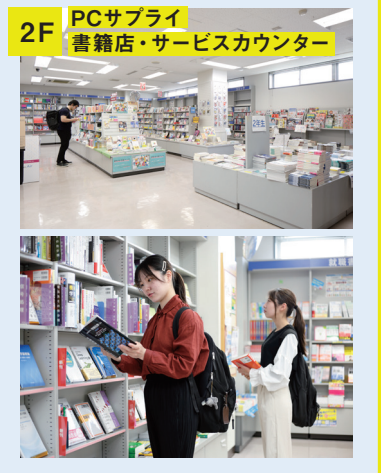
2F PCサブライ 書店・サービスカウンター