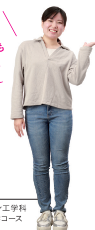
A.H.さん 地域未来デザイン工学科 社会インフラ工学コース