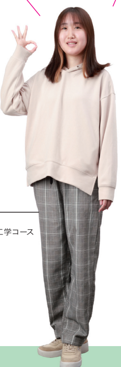
M.I.さん 地域未来デザイン工学科 情報デザイン・コミュニケーション工学コース